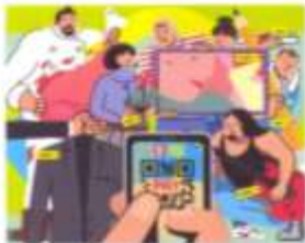
ร้านค้าบนมือถือ ไม่ต้องใช้เงินตรา P.99