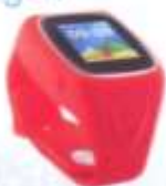
True Kid Watch อัจฉริยะสำหรับเด็ก P.83