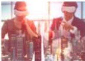
Digital Revolution เทคโนโลยีสมัยใหม่ P.49