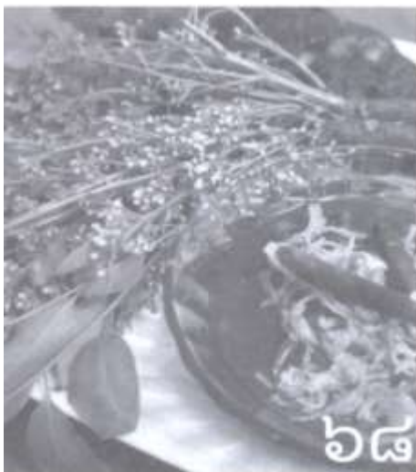
ช้างน้ำ ไม่มั่งคด แก้วปัดเมื่อย บำรุงร่างกาย