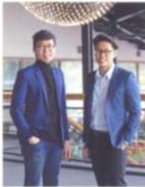
Money Buffalo บทสนทนาพิเศษ และ จิตรกรรณ กิจมรรัฐบุรุษ P.66