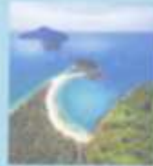
ช่างสาวสวย เกาะกูด อุทยานแห่งชาติเขาสก จังหวัดสุราษฎร์ธานี เมืองมรดกทางอากาศ พีระมิด นามมณฑลวิเศษ...ภาพ

ISSN 0125 7225 นิตยสารเพื่อการท่องเที่ยว และสุขภาพธรรมชาติ ศิลปะวัฒนธรรม ที่มีคุณค่าแห่งความสุขของคนไทย ปีที่ 57 ฉบับที่ 7 กุมภาพันธ์ 2560