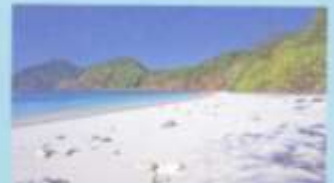
หาดทรายขาวสะอาดเป็นธรรมชาติ ของเกาะ Lord Howe พูโกย่ามีเกาะ ทะเลเมดิเตอร์เรเนียน จินจิวา อินทรีศักดิ์...ภาพ